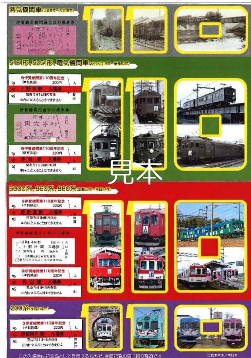
台紙内側（縦42cm、横14.7cm）※開いた状態