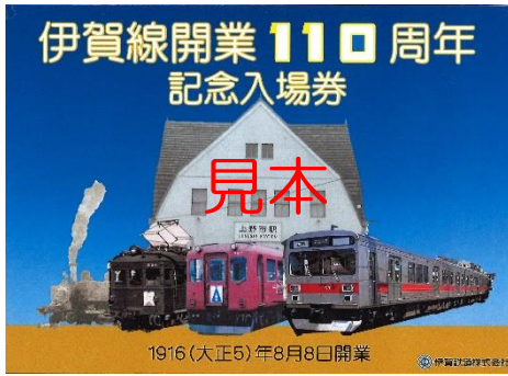
台紙外側表面（A5横サイズ）※閉じた状態