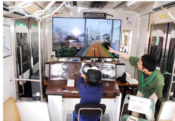
運転シミュレーション体験