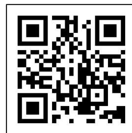
いがてつオンラインショップへ