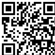
個人オーナープラン商品ページへ

※伊賀鉄道ホームページからは、トップページの「つり革オーナー募集」バナーから「いがてつオンラインショップ」の商品ページへリンクしています。