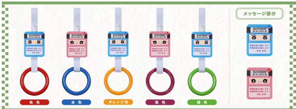
〔法人オーナー〕 たて 10.0 cm × よこ 8 cm メッセージは全角22文字（11文字×2行）