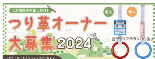
つり革オーナー募集バナー

※伊賀鉄道ホームページからは、トップページの「つり革オーナー募集」バナーから「いがてつオンラインショップ」の商品ページへリンクしています。