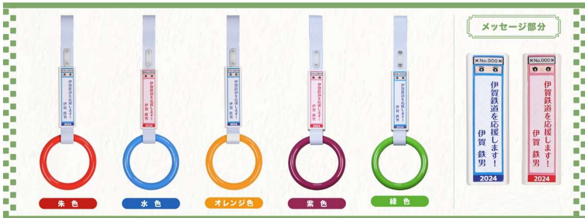
〔個人オーナー〕 たて 11.5 cm × よこ 2.5 cm メッセージは全角11文字（1行）