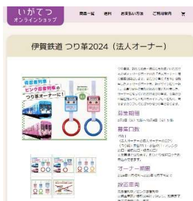
つり革オーナー商品ページ（法人オーナー）のイメージ