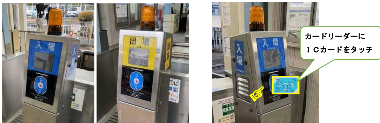
IC改札機(青:入場用、黄:出場用)