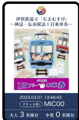
デジタル1日フリー乗車券のイメージ

アプリ内でお得な伊賀鉄道デジタル1日フリー乗車券の事前購入が可能です。探訪当日は事前購入したデジタル1日フリー乗車券をご利用できます。