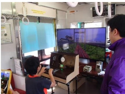
運転シミュレーション体験