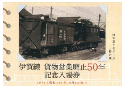
貨物営業廃止50年記念入場券セット（表紙）