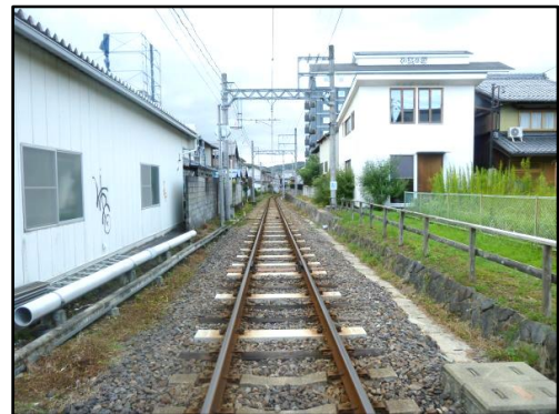
(PCマクラギ化工事 左：着手前 右：完成後)