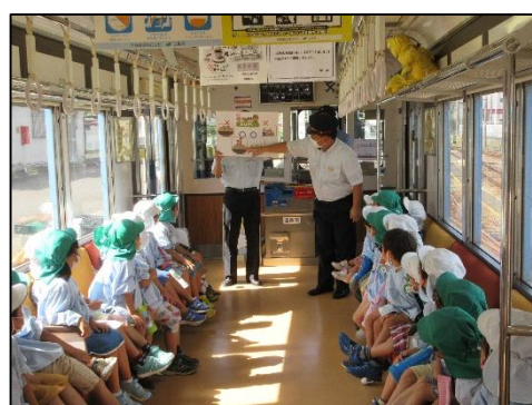
(電車の乗り方教室の様子)