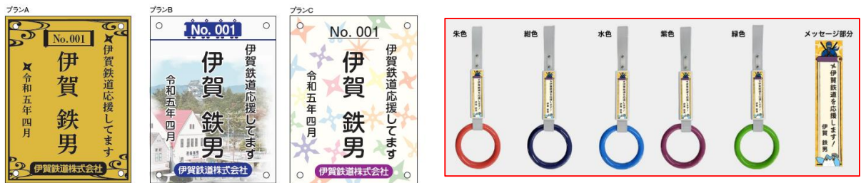
(3種類のまくら木オーナーのプレート)

沿線の企業や店舗の名称等を各駅に副駅名として表示し、代わりに広告料をいただく「駅名ネーミングライツ」については、四十九駅、茅町駅、丸山駅の3駅に加えて、令和4年4月より新居駅の副駅名が『伊賀を守る上野遊水地』となりました。