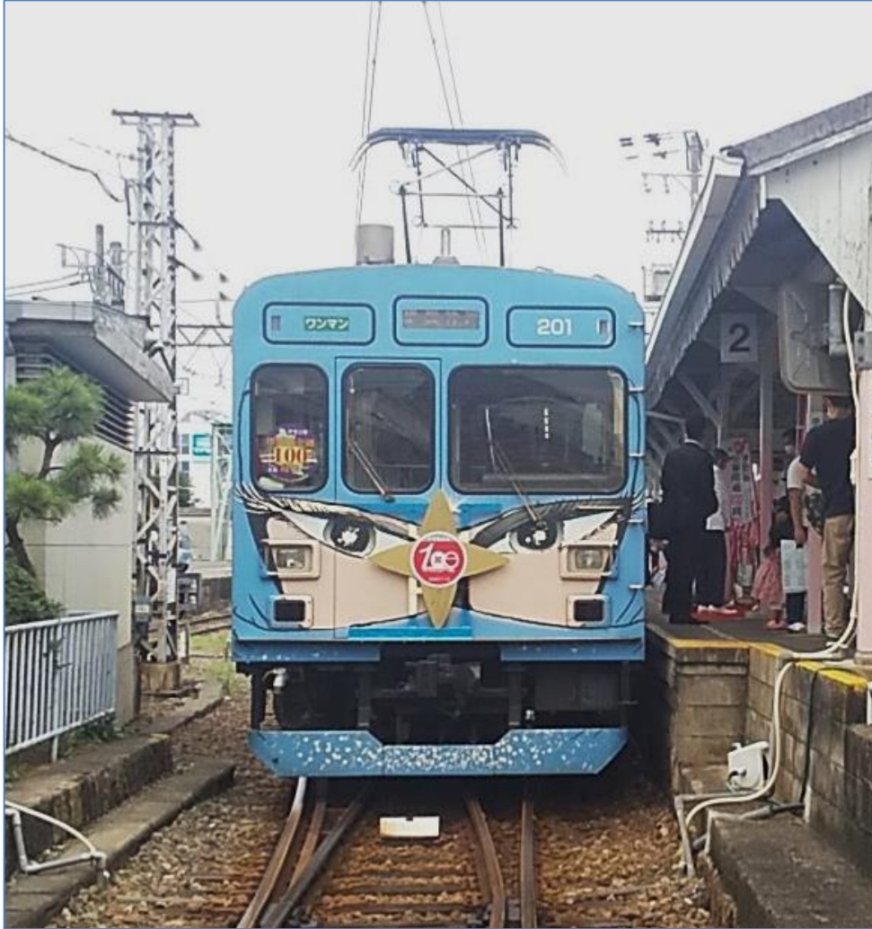
全線開通100周年記念ヘッドマークをつけた青忍者列車