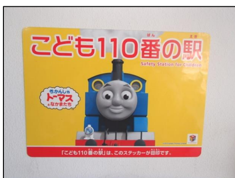
(こども110番の駅のステッカー)

伊賀市と協力して、伊賀市内の小学校や幼稚園・保育所（園）の児童・園児を対象に「電車の乗り方教室」を開催し、子どもたちの当社への関心を高めるとともに、電車利用に対するマナーを身につけてもらう取り組みを行っています。2022年度は8回開催し、計172人の子どもたちに参加していただきました。