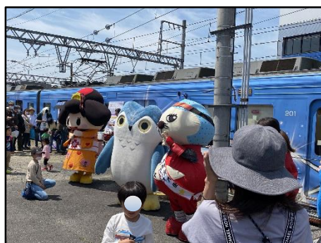
(伊賀線まつりの様子)

沿線地域の賑わいづくりに協力するべく、当社のサポーター団体である「伊賀鉄道友の会」や、沿線の施設・団体と共同で、様々なイベント列車の運行やイベントの開催を行っています。2022年7月18日には、100周年記念事業に合わせて『伊賀線まつり』をコロナ対策を行いながら、例年より規模を拡げて開催し、過去最多の3,000人以上のお客様にご来場いただきました。また、2022年10月22日には、「いがてつマルシェ」を上野市車庫で開催いたしました。キッチンカーや沿線のお店の商品の販売、また定番の伊賀線ジオラマや運転シミュレーション体験他でお楽しみいただきました。