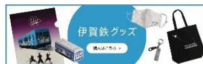
伊賀鉄グッズバナー

伊賀鉄道ホームページの中程にある「伊賀鉄グッズ」のバナーを押下してください。「いがてつオンラインショップ」に遷移しますので、商品一覧より「つり革オーナー」を選択ください。