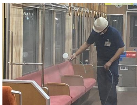
(車内の抗菌・抗ウイルス加工)