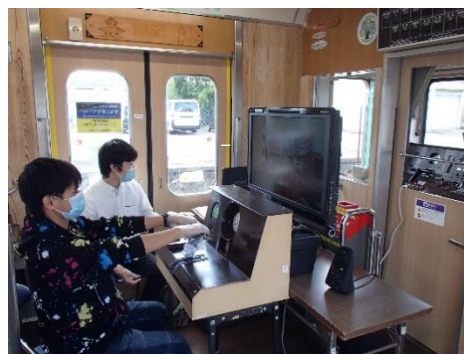
(いがてつマルシェの様子)