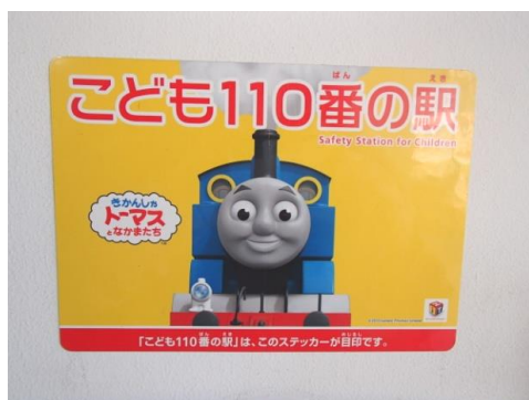
(こども110番の駅のステッカー)

伊賀市と協力して、伊賀市内の小学校や幼稚園・保育所（園）の児童・園児を対象に「電車の乗り方教室」を開催し、子どもたちの当社への関心を高めるとともに、電車利用に対するマナーを身につけてもらう取り組みを行っています。2020年度は8回開催し、計231人の子どもたちに参加していただいたほか、一般の親子連れのお客様を対象としても1回開催し、39人に参加していただきました。