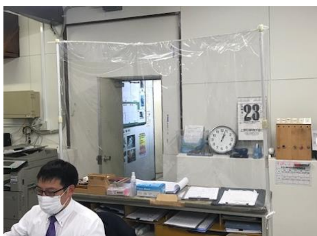
(点呼台にビニールシートを設置)

また、お客様により安心して伊賀線をご利用いただくために、2020年9月、伊賀市と連携して全車両の車内に抗菌・抗ウイルス加工を実施いたしました。