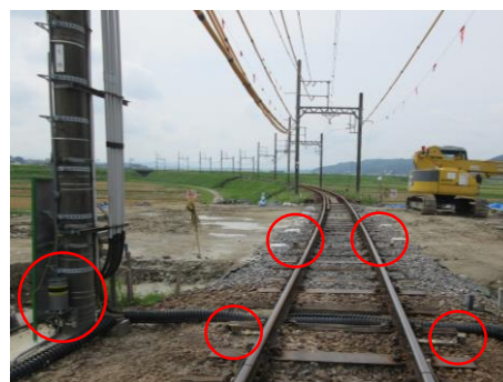
(計測機器の設置状況)

列車運行に影響を与えないよう、計測機器を設置して軌道の状態を監視しながら、無事故無災害で円滑な施工に努めてまいります。