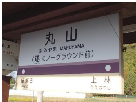
(丸山駅のネーミングライツ)

また2020年からは、オーナーのお名前やメッセージを表示したプレートを駅構内のまくら木に設置し、代わりに料金をいただく「まくら木オーナー制度」も開始いたしました。2021年4月から1年間、291枚のプレートを上野市駅構内等のまくら木に設置しています。