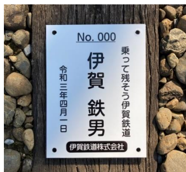
(まくら木オーナーのプレート)