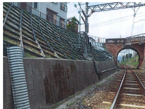
(線路際の法面防災対策工事 左：着手前 右：完成後)