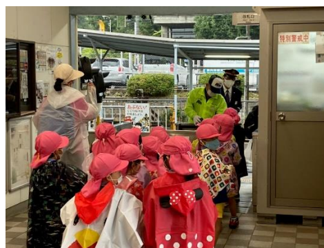
(電車の乗り方教室の様子)