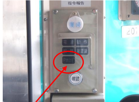
新設のP地上子表示灯（運転室内）