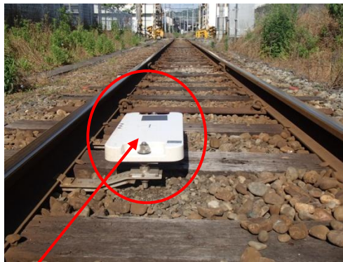
新設のトランスポンダ地上子