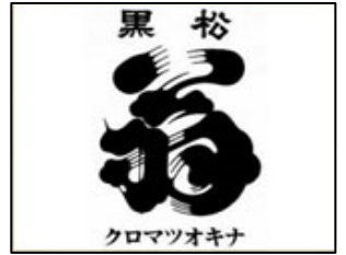
森本仙右衛門商店